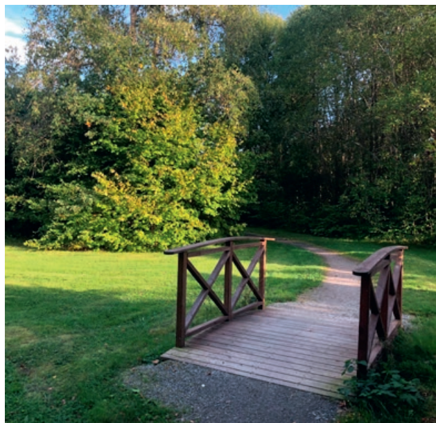
Blåvingegatan 2024, fotograferad från ungefär samma ställe som bilden ovan. Växtligheten har etablerat sig väl.