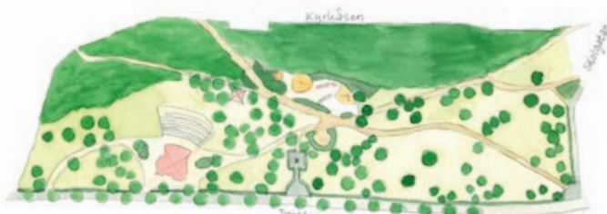
Skolparken, plan. Illustration Lars Johansson