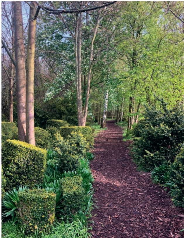
Skapad miljö i Alnarps landskapslaboratorium 2023.