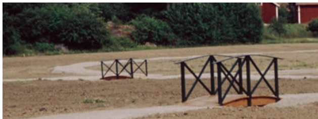
Blåvingegatan nyanlagt med gångvägar och träbroar över de låga svackdikena för dagvatten. Ännu ej planterat.

Samtliga bilder är fria för publicering i samband med denna titel