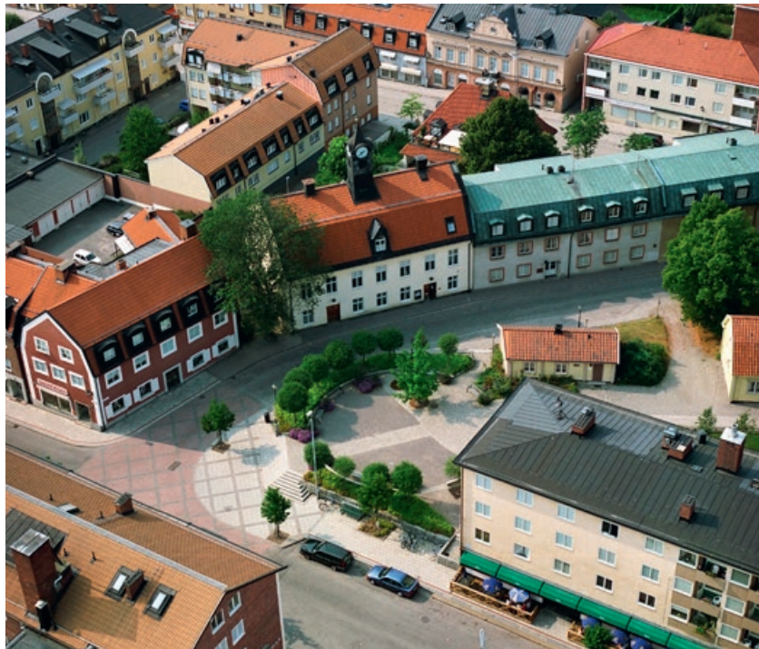
Kaplanen i Enköping efter ombyggnad. När platsen öppnades upp kom den att användas av fler människor än innan ombyggnad. Gestaltningen är en illustration av landskapsarkitektur à la Lars.