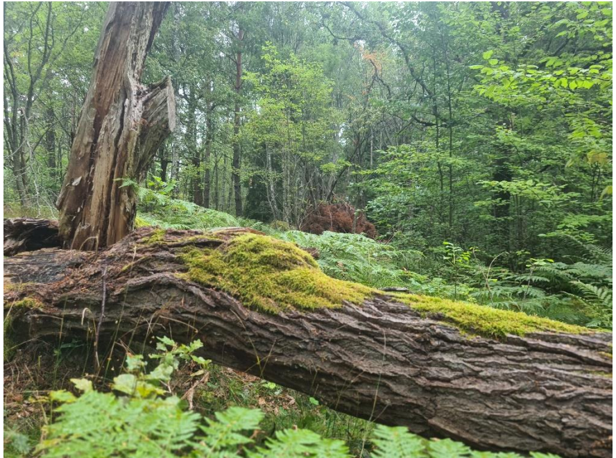
Kaknäskogen, en del av nationalstadsparken.