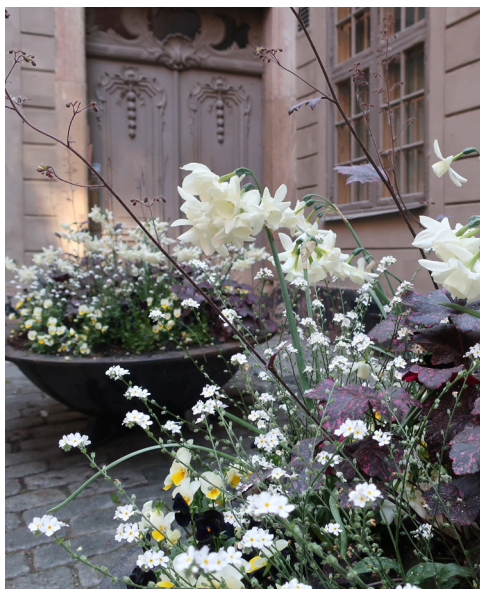
2019 Tema vitt/purpur – en hyllning till stadens skog som associerar till soliga gläntor och vita blommor i dunkla skogsdungar. Markens mossor, vilda örter och doften av våta löv inspirerar planteringarnas fria kompositioner med bland annat förgätmigej, daggkäpa, ljung och ormbunkar.