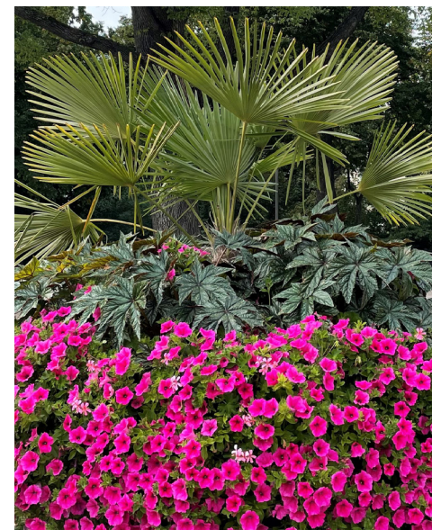
2021 Tema orange/rött/rosa – inspirerat av Stockholms parker som varit och förblir viktigare än någonsin under pandemin. En hyllning av det sena 1800-talets parkpionjärer genom ett blomstertema som återspeglar den tidens vurm för tropiska och färgstarka växter.