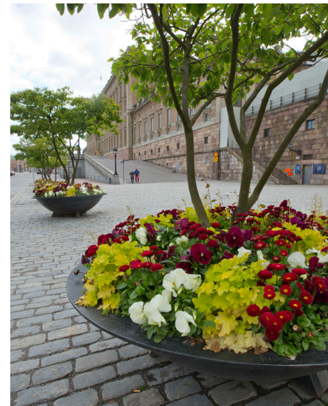
2015 Tema vaniljgult/rött – inspirerat av smultronstället, fyllt av vita blommor och röda bär.