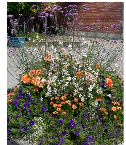
2023 Tema lila/vit/orange/silver – "Under ytan, ovan molnen", inspirerat av korallrev och rymden i både färgval och karaktär på blommor och blad.