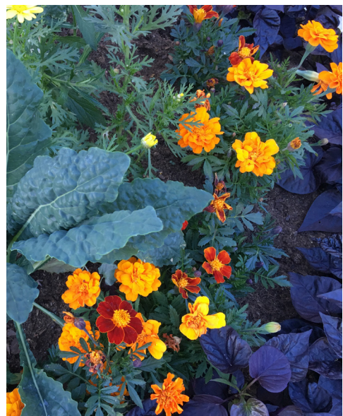
2018 Tema orange/violett – inspirerat av köksträdgården som friskt blandar dekorativa bladgrönsaker, örter och mer traditionella sommarblommor i tydliga mönster med plantor i rader och med en inramande kant.