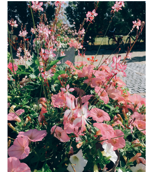
2017 Tema rosa/violett – en hyllning till författaren Per-Anders Fogelström med en blandning av täppans blommor som förgätmigej och violer och med doft av rosor, syren och heliotrop.