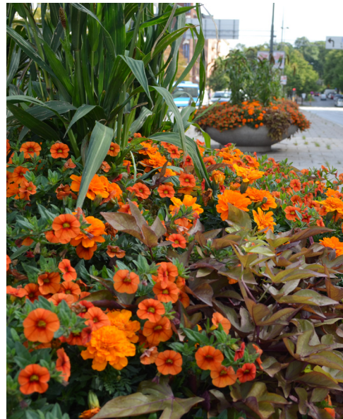
2012 Tema orange/rosa – inspirerat av Stockholms egen färgskala, de karaktäristiska putsfasaderna, Slottets rosa sandsten och Stadshusets tegelvalv.