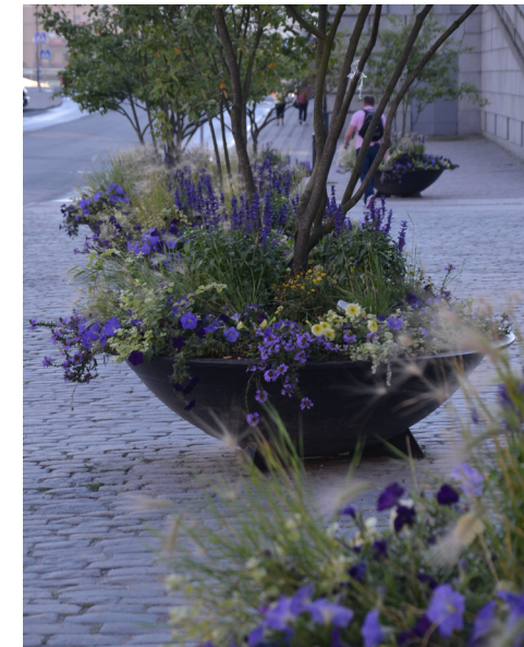
2016 Tema citrongult/lavendelblått – inspirerat av ängens blandning av gräs och örter