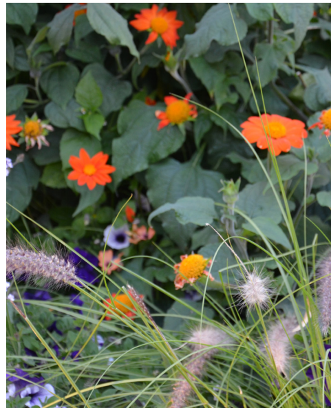
2014 Tema violett/orange inspirerat av den impressionistiske konstnären Claude Monets trädgård i Giverny.