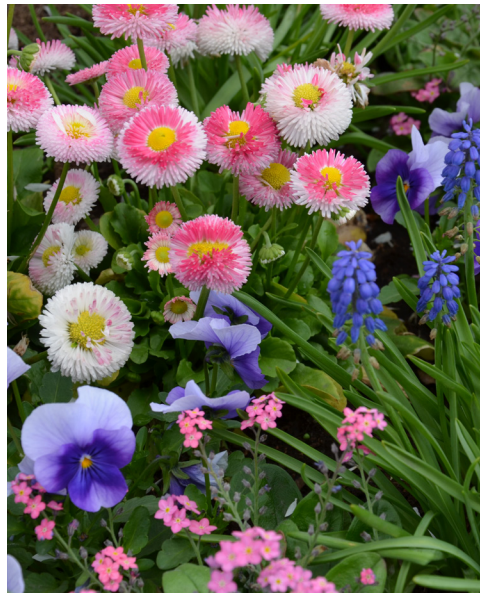
2013 Tema rosa/blått – inspirerat av det kinesiska porslinet Famille Roses växt- och blommönster i milda nyanser av rosa, porslinsblått, vaniljgult och ärggrönt.