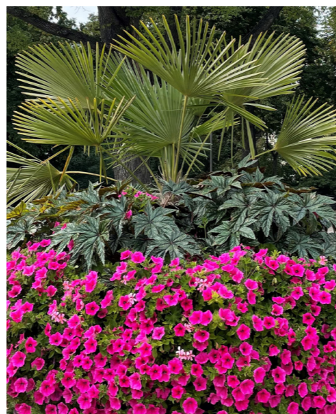
2021 Tema orange/ rött/rosa – inspirerat av Stockholms parker som varit och förblir viktigare än någonsin under pandemin. En hyllning av det sena 1800-talets parkpionjärer genom ett blomstertema som återspeglar den tidens vurm för tropiska och färgstarka växter.