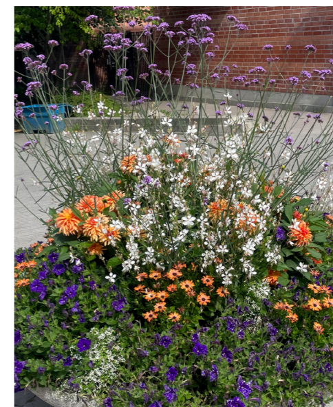
2023 Tema lila/vit/orange/silver – "Under ytan, ovan molnen", inspirerat av korallrev och rymden i både färgval och karaktär på blommor och blad.