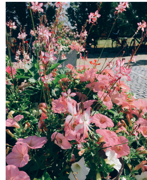
2017 Tema rosa/violett – en hyllning till författaren Per-Anders Fogelström med en blandning av täppans blommor som förgätmigej och violer och med doft av rosor, syren och heliotrop.