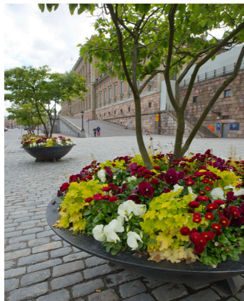
2015 Tema vaniljgult/rött – inspirerat av smultronstället, fyllt av vita blommor och röda bär.