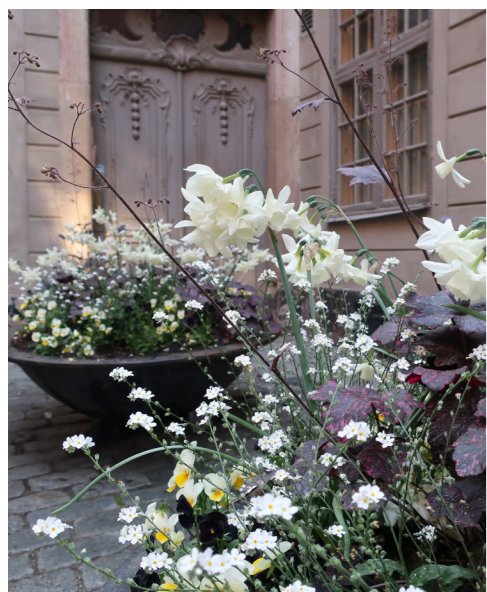
2019 Tema vitt/purpur – en hyllning till stadens skog som associerar till soliga gläntor och vita blommor i dunkla skogsdungar. Markens mossor, vilda örter och doften av våta löv inspirerar planteringarnas fria kompositioner med bland annat förgätmigej, dagdkåpa, ljung och ormbunkar.