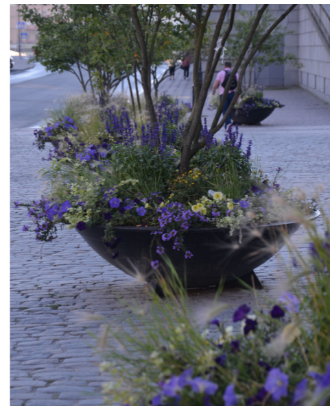
2016 Tema citrongult/lavendelblått – inspirerat av ängens blandning av gräs och örter