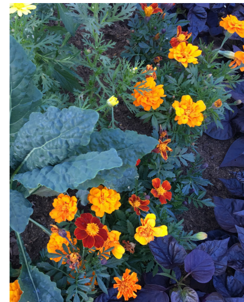
2018 Tema orange/violett – inspirerat av köksträdgården som friskt blandar dekorativa bladgrönsaker, örter och mer traditionella sommarblommor i tydliga mönster med plantor i rader och med en inramande kant.