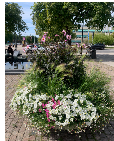
2024 Tema Rosa/vit/ljusgul – “Spirande romans”, inspirerat av kärlek och romantik i både växtval, färg och kompostitation.