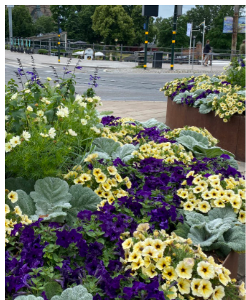
2020 Tema vitt/lila/blått – inspiration från Östersjön och Stockholms skärgård. Växterna skildrar skärgårdens alla föränderliga faser, över dygnet och över året. Floret går i nyanser av blått och vitt med inslag av gult och rosa. Några är förädlade släktingar till växter i skärgårdsfloran som t.ex. blå viol, tall och strandråg.