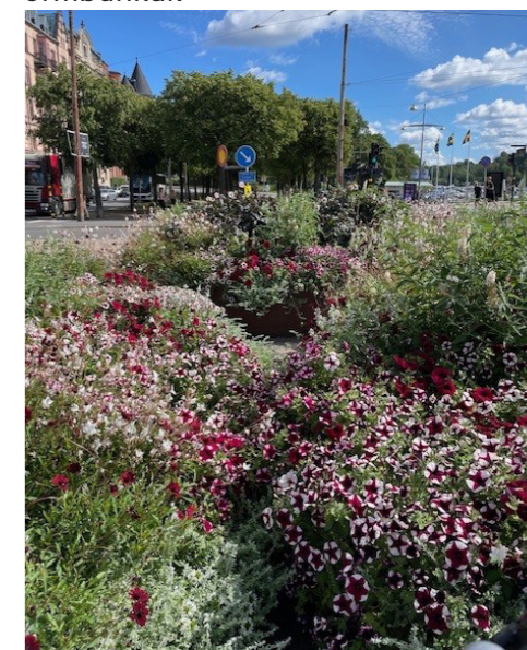
2025 Tema Röd/vit/ljusgul – “En galafest för alla!”, inspirerat av den röda mattan som rullas ut och där blommorna bjuder in till en föreställning dit alla är välkomna. I planteringarna finns stora, pampiga blommor med mustiga kulörer i mörkrött, rostbrunt, blekgult och vitt.