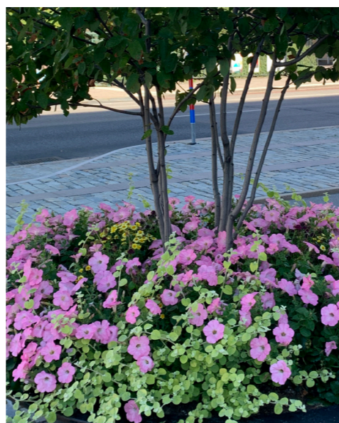
2022 Tema gräddvit/grönt/ljusrosa/ gult – inspirerat av funktionalismen och Stockholms parkhistoria. Färgskalan är inspirerad av textil- och porslinsmönster från 1900-talets mitt. Även sortvalet är infuerat av tiden.