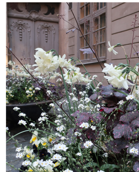
2019 Tema vitt/purpur – en hyllning till stadens skog som associerar till soliga gläntor och vita blommor i dunkla skogsdungar. Markens mossa, vilda örter och doften av våta löv inspirerar planteringarnas fria kompositioner med bland annat förgätmigej, daggkäpa, ljung och ormbunkar.