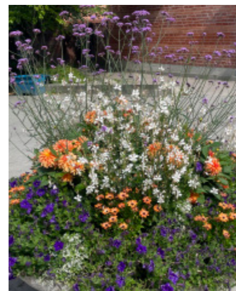
2023 Tema lila/vit/orange/silver – “Under ytan, ovan molnen”, inspirerat av korallrev och rymden i både färgval och karaktär på blommor och blad.