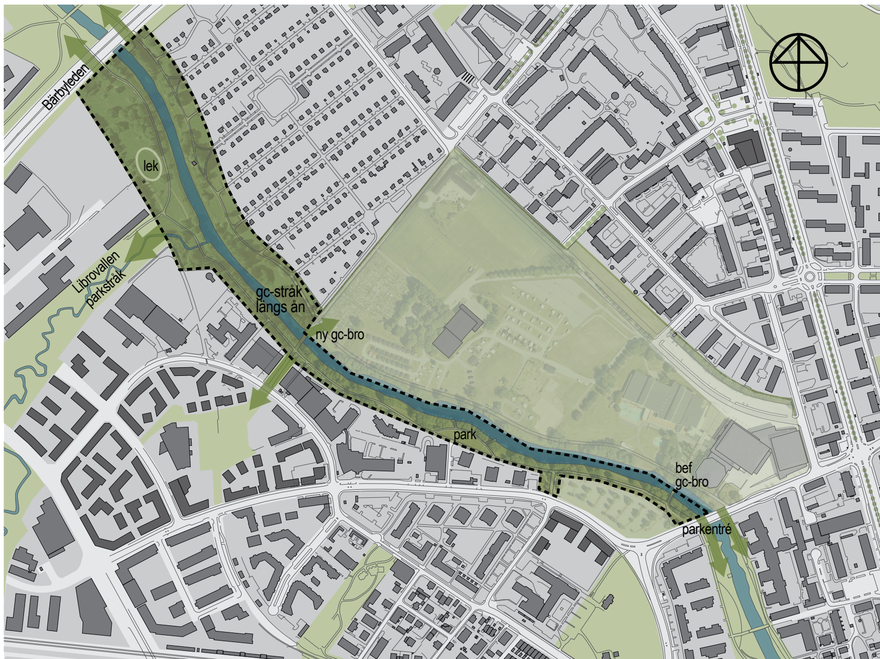
PLAN (ORTO UTZOOMAT) - FOKUS PÅ DELOMRÅDE 5