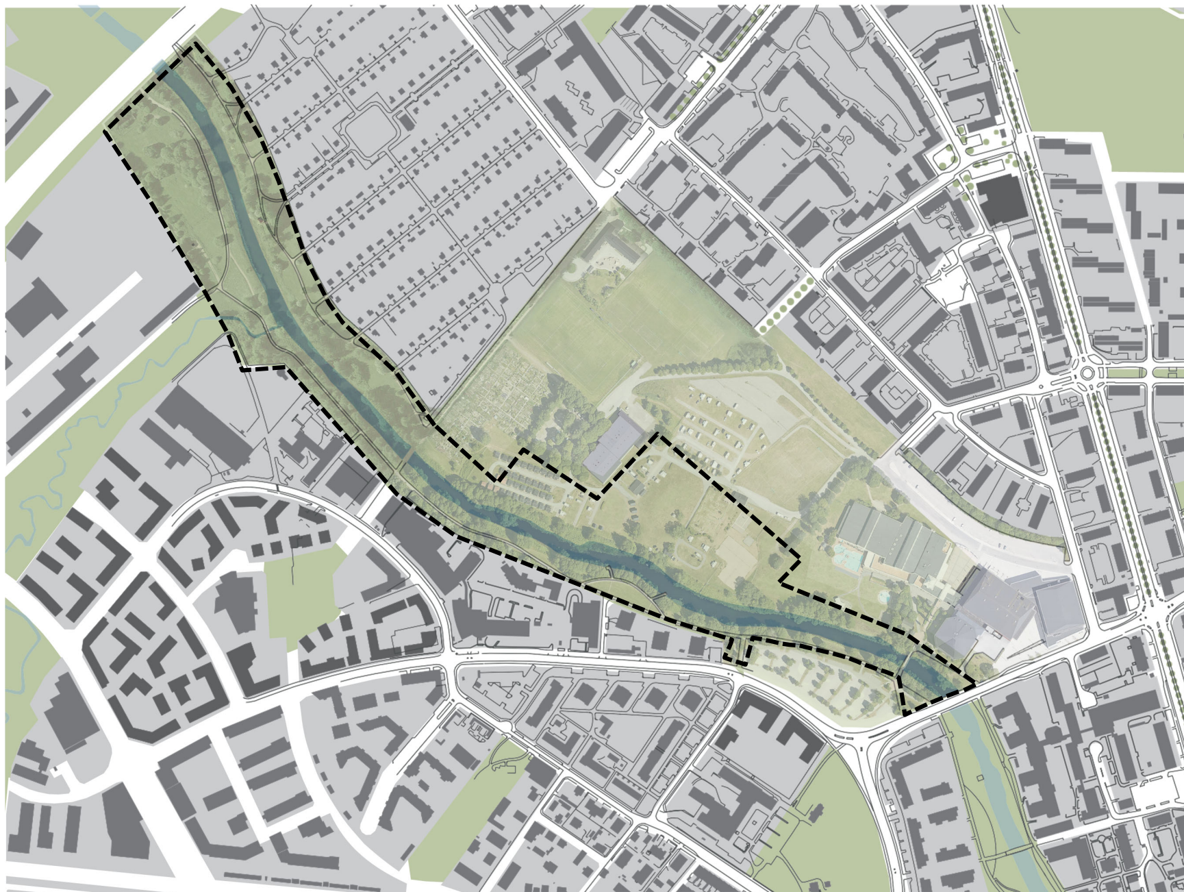
PLAN (ORTO UTZOOMAT) - DE 5 DELOMRÄDENA