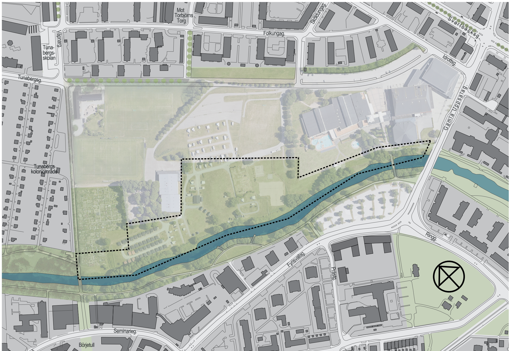
PLAN (INZOOMAD VRIDEN) - FOKUS UTVECKLING - DELOMRÅDEN 2, 3 & 4.