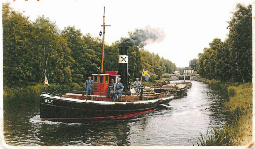
Ångbogseraren REX, Surahammar