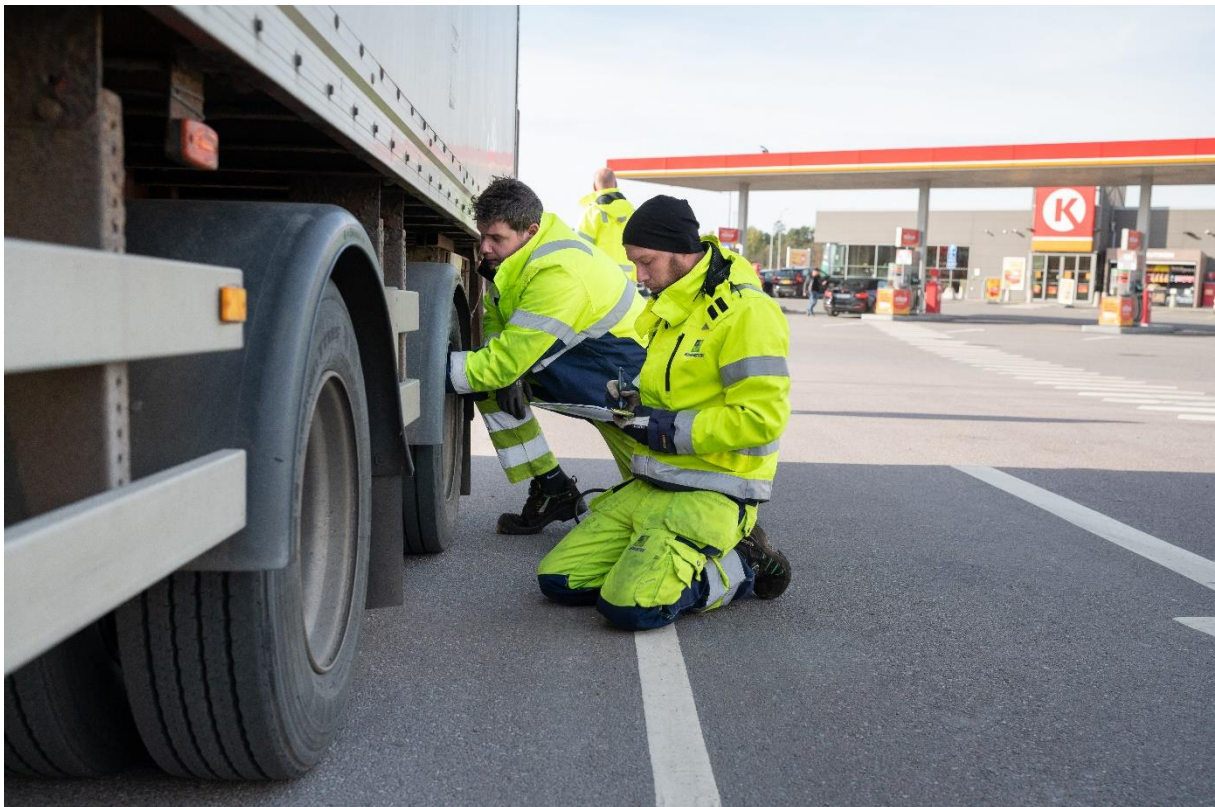
Inspektionerna genomfördes 15-16 oktober i Malmö, Göteborg, Mantorp och Gävle. Totalt 706 däck kontrollerades.

Att delta i kontrollen var självklart frivilligt och informationen om fordonets skick kommunicerades sedan till föraren.