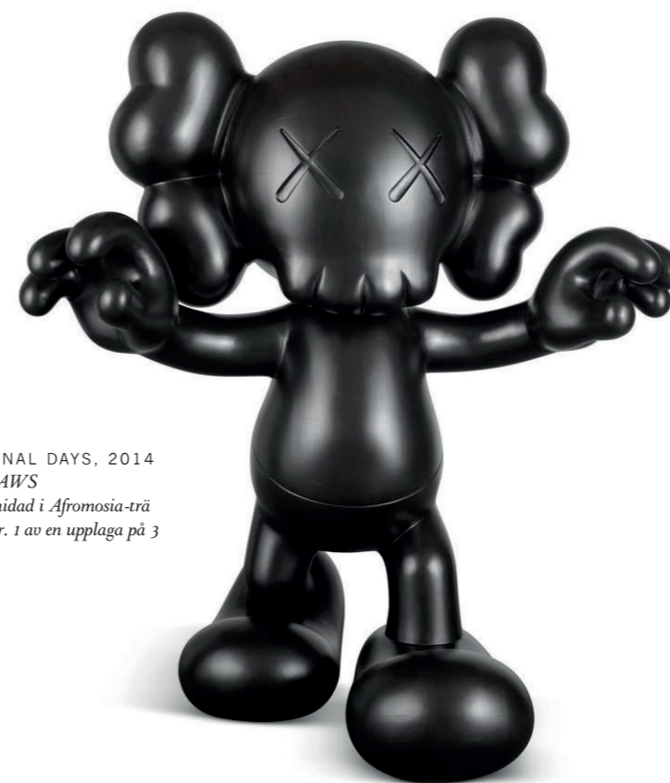
FINAL DAYS, 2014 KAWS Snidad i Afromosia-trä Nr. 1 av en upplaga på 3

KAWS – för första gången med ett permanent verk i Stockholm.